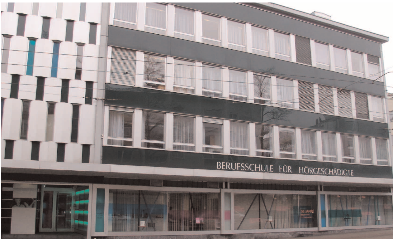
Die Schule befindet sich in Zürich Seebach