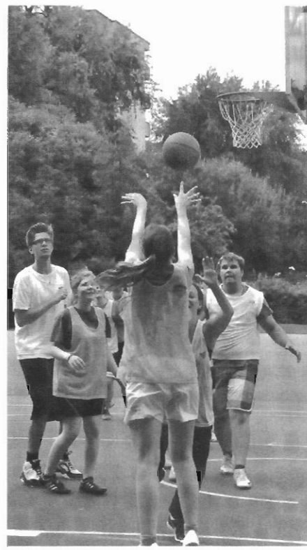
Präzision beim Wurf

Basketball wurde im Jahr 1891 vom kanadischen Trainer James Naismith als Hallensport erfunden. Heute hat der Basketballsport weltweit, besonders in den USA, einen hohen Stellenwert. Alle vier Jahre findet in einem jeweils anderen Land eine Basketball-Weltmeisterschaft statt, die von dem Weltbasketballverband Fédération Internationale de Basketball veranstaltet wird. Laut Weltbasketballverband FIBA spielen etwa 450 Millionen Menschen weltweit Basketball.