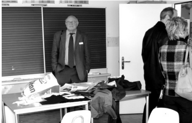
Im Klassenzimmer der bimodalen Klasse werden derzeit insgesamt sechs SchülerInnen sowohl mit Gebärden- als auch mit Lautsprache unterrichtet.