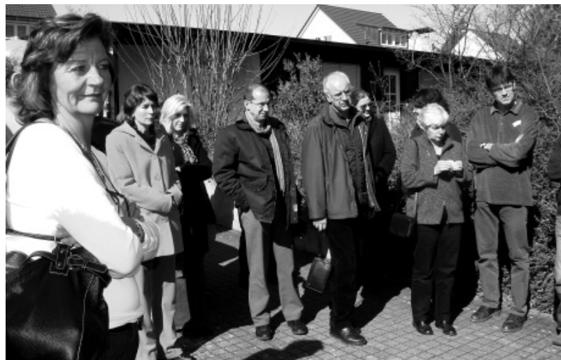
Bei strahlend schönem Wetter folgen die ForumsteilnehmerInnen den Ausführungen auf dem Rundgang durch das Schulgelände aufmerksam.