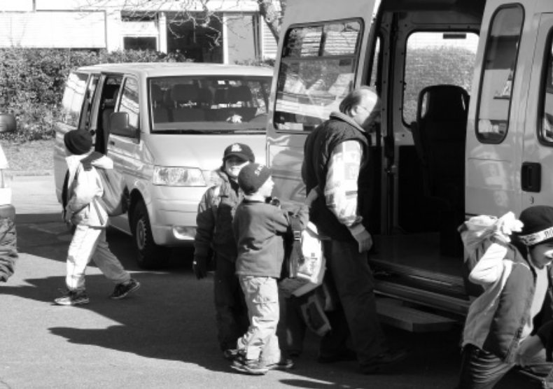
Ein paar Schülerinnen der Sprachheilschule tummeln sich auf dem Spielplatz, bevor sie mit dem Schulbus für die Mittagspause heimgefahren werden.