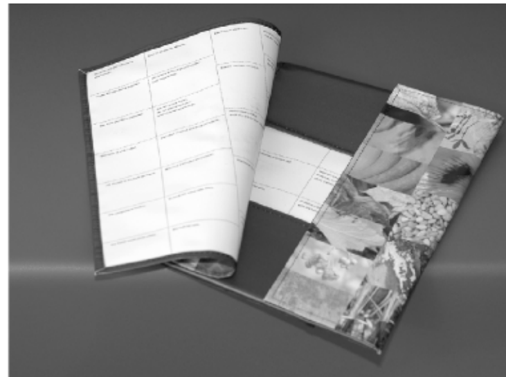
Offene «ine-use» Mappe